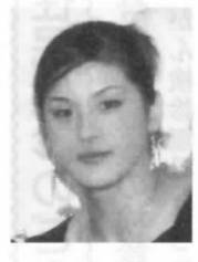
(バスケットボール競技) 馬瀬2