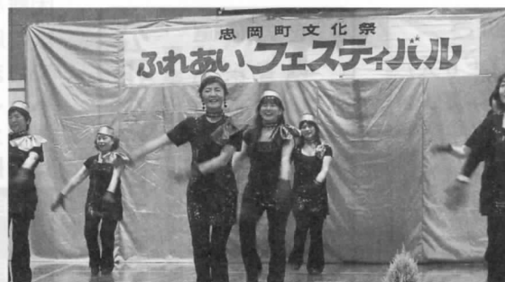
▲ 日頃の練習成果を見てください!!