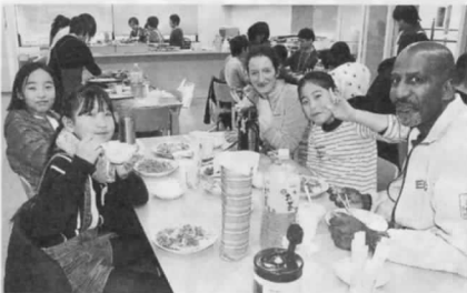
▲地車の前で ハイポーズ ◀みんな揃って 楽しいお昼！