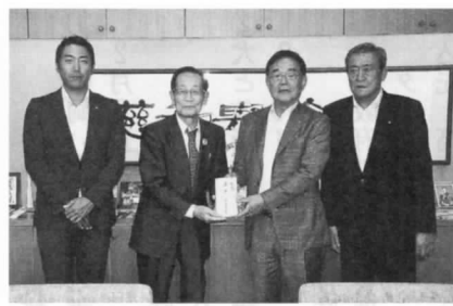
{キワニス…世界的な児童虐待防止活動団体}