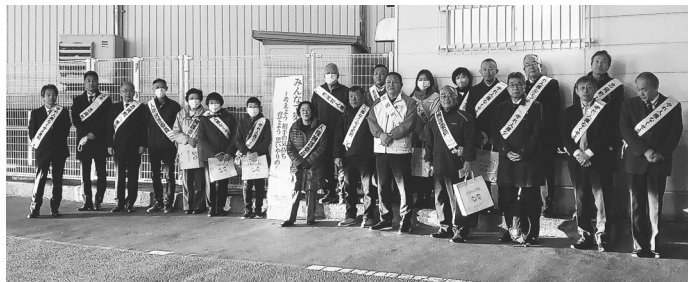
▲「人権週間」啓発 (12/4・忠岡駅前/人権協会・人権擁護委員) ▼「女性への暴力をなくす運動」啓発 (11/28 ・ライブ前/女性フォーラム実行委員会)

学校で経験できない地域の人との繋がりや自主性・社会性を高めたり、自然に接する活動やスポーツ・文化活動を通じて創造性や活力を養うすばらしい場であり、また保護者の方が地域の人達と交流できるきっかけにもなります。 【問】生涯学習課 ☎90-5300