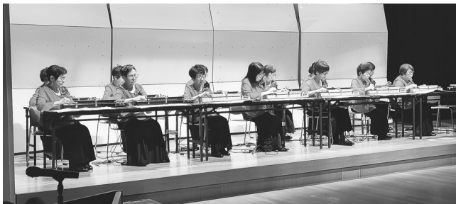
▲大正琴の演奏「結実会」

町民音楽祭 (11/19・ふれあいホール) ▲メインゲストの演奏 ハーモニーが心をつなぐ