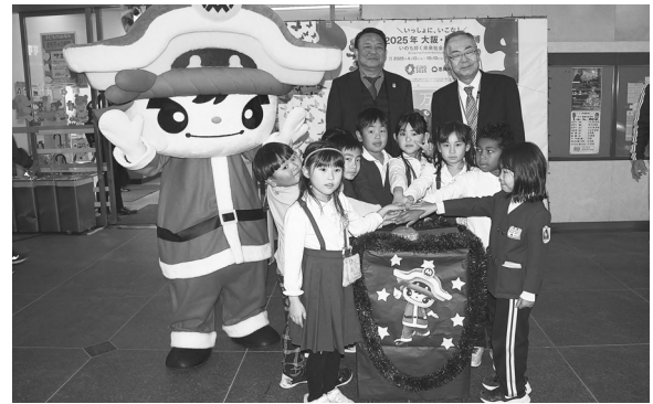
ユメナリエ点灯式