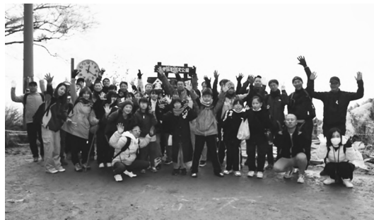
▲みんなで登るのは気持ちいい!