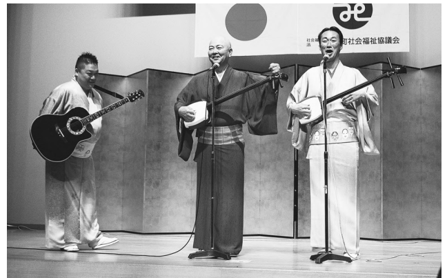
▶漫才に笑顔が広がります