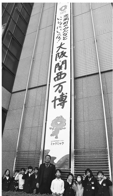
▲どんな素敵な未来があるのか楽しみです！

大阪・関西万博の開幕が500日を切り、 庁舎に機運を盛り上げる懸垂幕 杉原町長と子どもたちの手で、長さ11mの懸垂幕が役場庁舎 にかけられました。