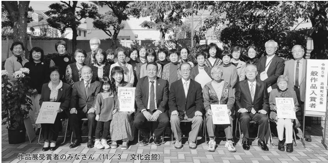
作品展受賞者のみなさん (11/3 文化会館)