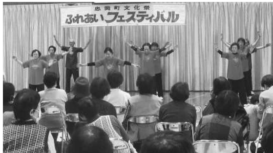
▲元気一杯の発表 (ふれあいフェスティバル)