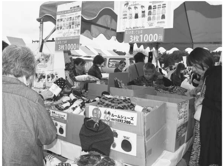
◀ ▲ 開会と同時に各販売ブースは満員御礼！