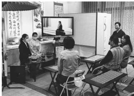
▲どうぞ一服 (子どもお茶会)