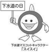
下水道マスコットキャラクター「スイスイ」