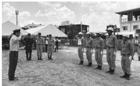
▲大阪市消防局高度専門教育訓練センター（東大阪市・7/22）