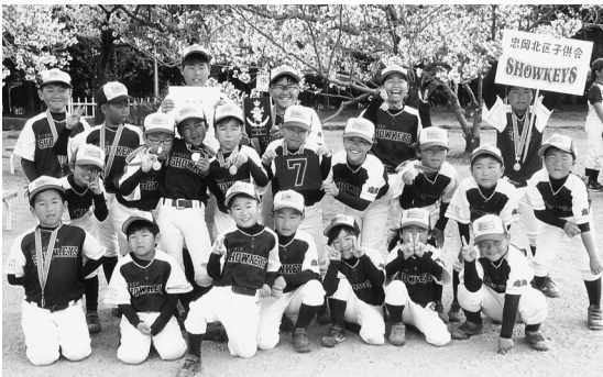
忠岡北区子供会ショーキーズ