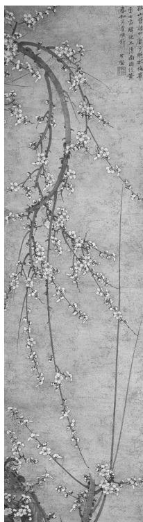
▶重要文化財「墨梅図」絶海中津賛