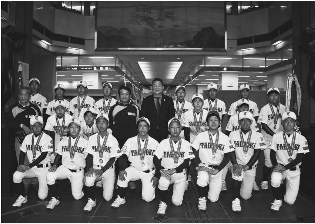
▲第53回春季大会大阪南支部予選を優勝で飾り全国制覇への抱負を杉原町長に報告