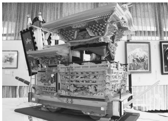
▲力作が揃いました！