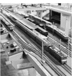
アマチュアHOG 鉄道模型クラブ

～HOGゲージ運転会～ 車輪持込・写真撮影OK! とき 12月24日(土) 12時15分～16時/12月25日(日) 10時～15時 参加費無料 ところ 1階ロビー