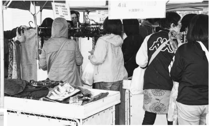
◀小雨の中でもたくさん 来場者でにぎわいました