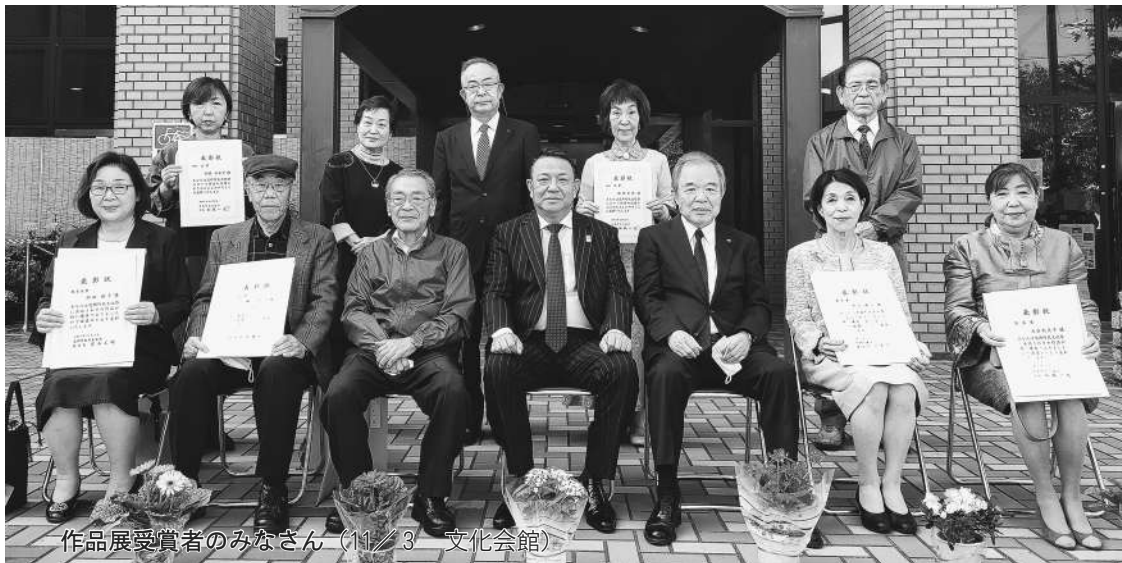
作品展受賞者のみなさん（11/3 文化会館）