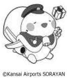
SORAYAN

2023年2月には、カード会員さま向けキャンペーンも実施予定です。 詳細はKIX-IITMカードホームページで随時ご紹介していきますので、2次元コードからウェブサイトをチェックしてみてください。