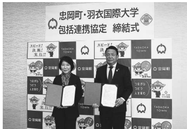
▲調印文書の交換（役場交流センター・10/27）