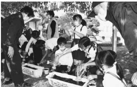
▲人権擁護委員さんといっしょに 球根を植えました(11/10)