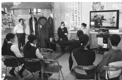
▲対面のお手前にちょっぴり ドキドキしました