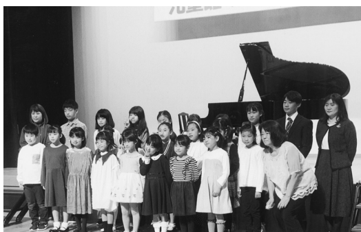
▼ピアノ教室の合同発表会