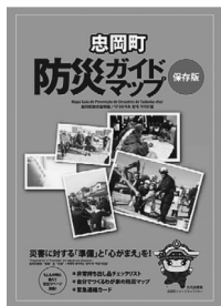
防災ガイドマップ (平成26年3月作成)