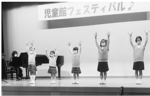
▲こども合唱教室【メンバー募集中です!】