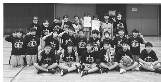
▲やったよ!! 笑顔いっぱいの選手達