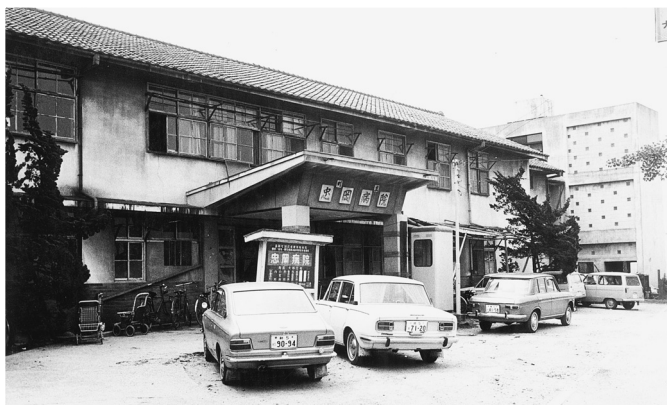
▲昔は町立病院がありました（初代公立忠岡病院） （昭和30年頃）