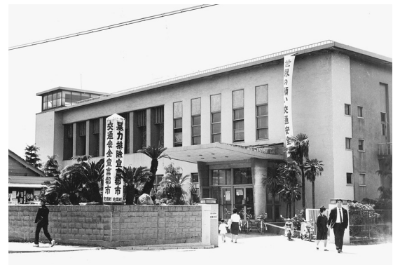
◀2代目庁舎（昭和31年頃）