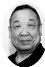
忠岡町地車連合会会長