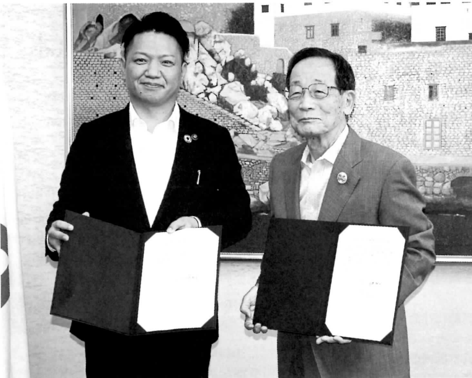
▶調印文書を交換する