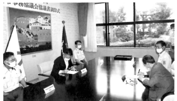
▼調印式の様子【9/16 忠岡町交流センター】

これは、広域的な消防相互応援体制の強化による住民の安全・安心のより一層の向上や業務の効率化を図ることを目指すもので、今後、岸和田市消防本部内に岸和田市・忠岡町消防指令センターを設置し、令和3年4月1日に運用をスタートする予定です。