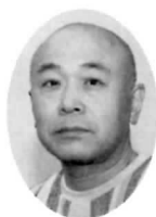
忠岡町地車連合会 安全委員長