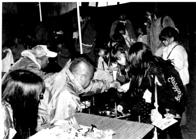
メイン会場の忠岡神社 冬の夜店を楽しみました(協力： 忠岡町子ども会育成者協議会)

開催日の12月1日は、地域の皆様には心あたたま るご協力を頂き、ありがとうございました。