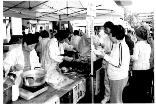
▲模擬店には朝から大勢のお客さんでいっぱい!!