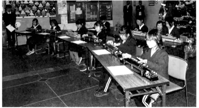
▲大正琴やダンスの発表もありました