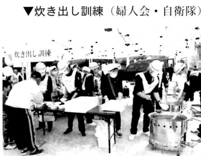
▼炊き出し訓練(婦人会・自衛隊)

日時 1月10日(金) 11時から 場所 いずみおおつCIT Y1階イベント広場 (南海泉大津駅東側) 内容 110番防犯教室/ 園児鼓隊演奏/白バ イ・パトカー展示等 【問】泉大津警察署 ☎23・1234