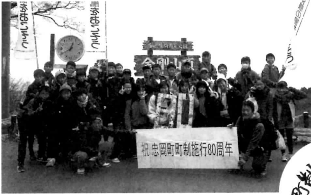
▲少年団金剛登山山頂で (12/8)