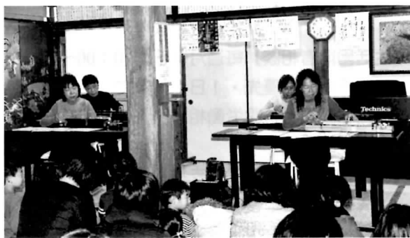
大正琴の演奏も 楽しみました