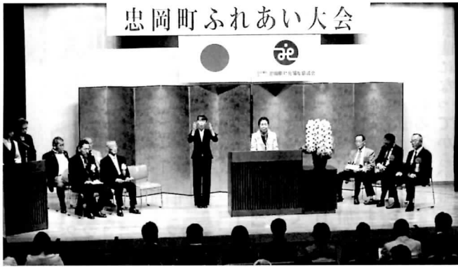
▲挨拶する社会福祉協議会上ノ山会長