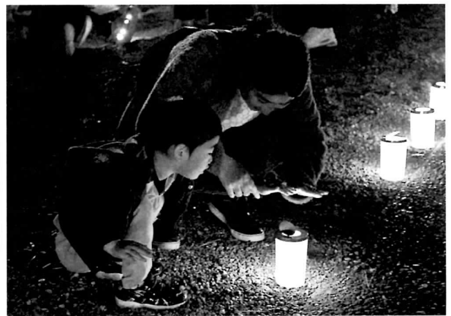
当日は、ご家族連れなど大勢の住民皆さんが参加され、灯籠に火を燈しました。(12/1)

この一年の皆様のご健康とご多幸を心よりお祈り申し上げ、新年のごあいさつといたします。