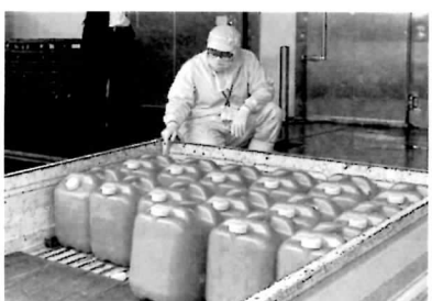
くら寿司様 (消毒液3000リットル)