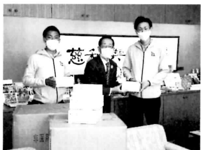
ケアショップ ハル様 (マスク5000枚)