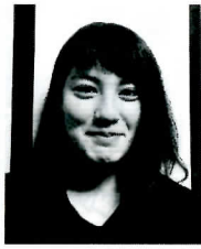
〔四天王寺羽曳丘高等学校〕