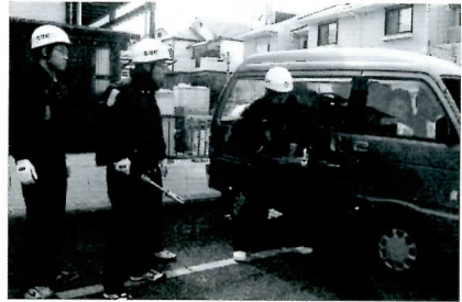
▲消防団員と消防署員の連携作業