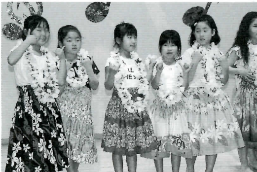
▶素敵な衣装で リズムもパッチリ!!