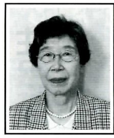
元民生委員・児童委員協議会会長 (東2)