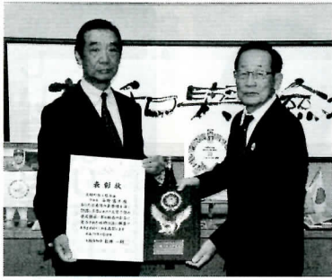
〔大阪府消防表彰式消防功労表彰〕