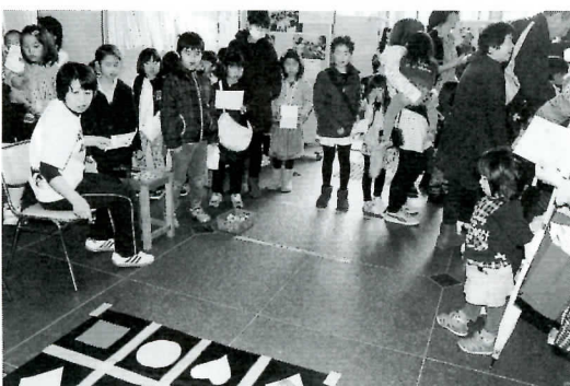
▶手づくりゲームがたくさん用意され大にぎわいでした

今年の児童館フェスティバルは、ピアノやフラなどの児童教室の発表会とともに、いろいろな手づくりゲームやオーストラリアの友好都市のお友達に手紙を書くコーナーなどが設けられて、300人を超える子どもたちが、楽しい一日を過ごしました。