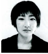
〔四天王寺羽曳丘高等学校〕