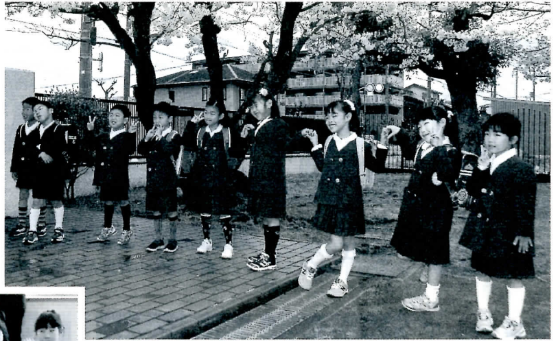
▲桜の下で仲良くポーズ（東小）