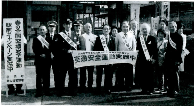
▶駅前での啓発活動