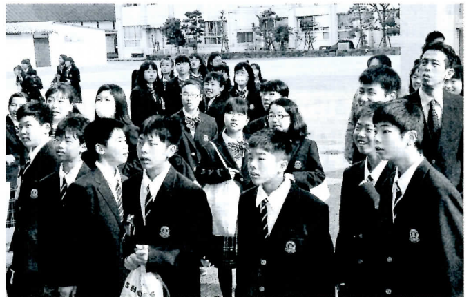
▲クラス発表に見入る生徒たち ◀ 同じクラスかな？（忠中）