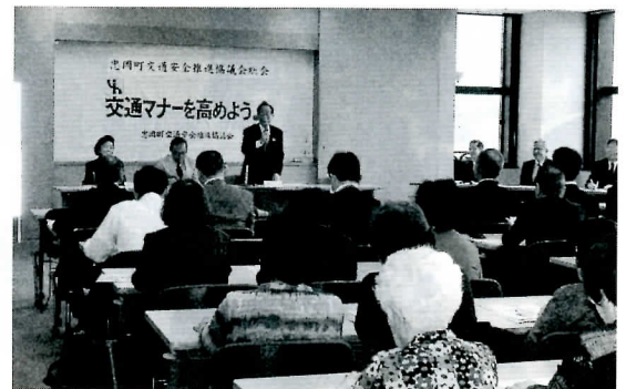
▶交通安全推進協議会総会