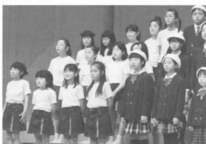
▲泉北合唱祭で元気いっぱい唱歌うバンビーナ(3/5・高石市)