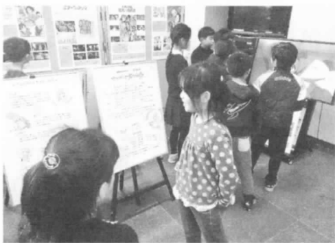
◀ 武田氏のアニメ作品 展示会も大人気!