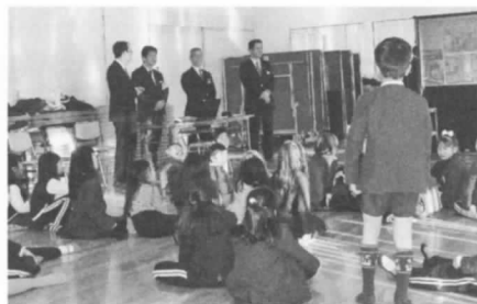
▲南海電鉄からの出前講座 制服も着せてもらったよ!