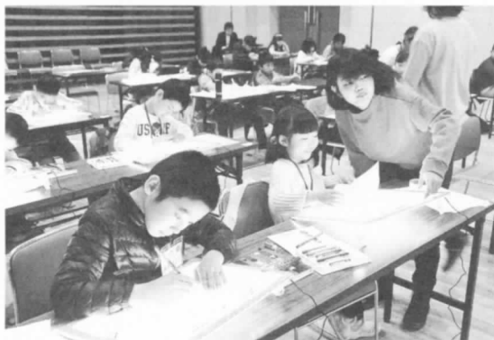
▶ みんなで一緒に 作品づくり!