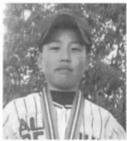
大阪泉州ボーイズ (東小6年) 東3