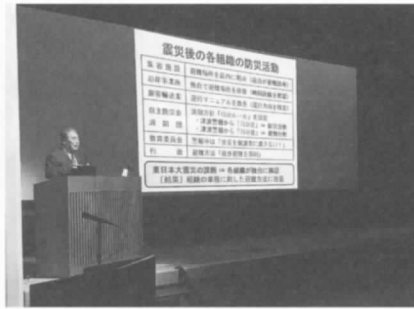
▲140名の参加者が熱心に聴き入る