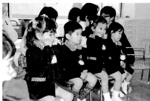
▶ちょっぴりドキドキ (忠幼)