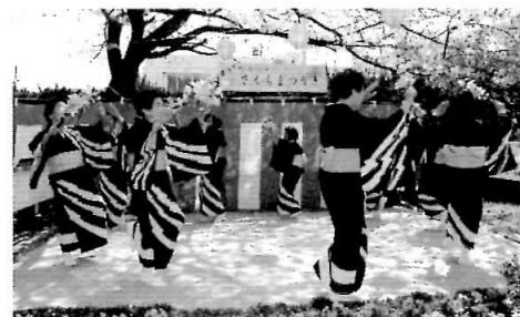
▲福祉センター『さくらまつり』(4/2)