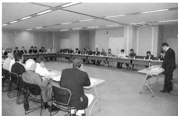
▲各地区自主防災会など各種関係団体への プラン説明会（4/11）

自力避難の困難な方が、この制度に登録されることで、地域のつながりにより、被災される方をなくすことを目的としています。