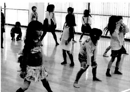
教育コミュニティ推進事業を受けています

児童館キッズクラブ 新学期スタート たくさんのお友達を迎えて 始まりました。今年はどうな 発見があるかな？