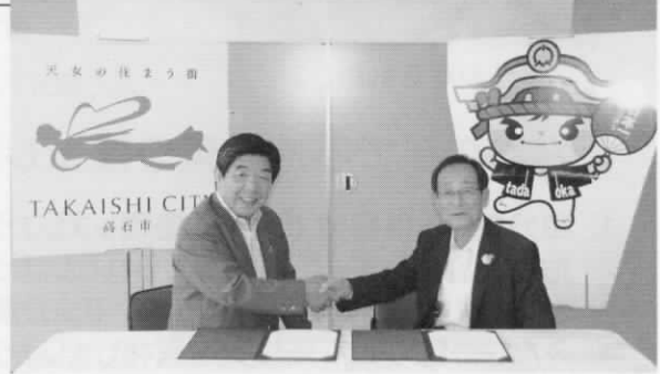
「高石市・忠岡町自治体クラウド」協定調印式

7月31日、高石市役所において忠岡町と高石市は、大阪府下で初めて共同利用型による自治体クラウドを導入することに合意し、協定書締結の調印式が行われました。 自治体クラウドは、災害時における業務継続や情報保全の確保、割り勘効果での運用コストの削減、セキュリティの充実も図ることができます。今後は、協議を進めて平成26年度の運用開始を目指します。