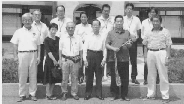
▶当日参加のみなさま