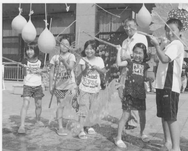
▼みんなでオープニング! 打ち水大作戦 (シビックセンター・8/2)