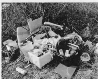
不法投棄されたごみ