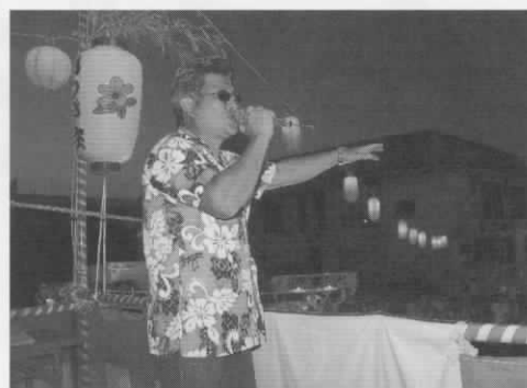
▲いけちゃんもゲスト参加して盛り上がった町民盆踊り大会(8/13)