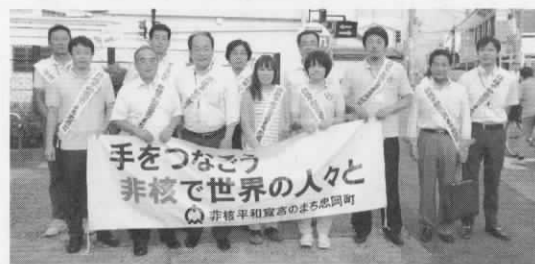
▲「手をつなごう 非核で世界の人々と」