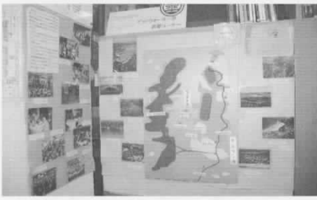
▲図書貸し出しのほか同市との友好の歴史を紹介