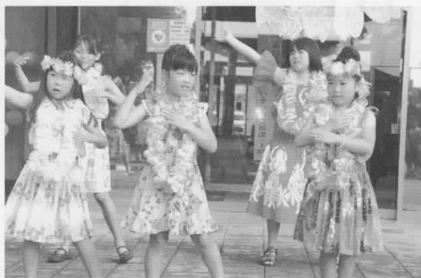
▲半年前から練習してきたよ (キッズフラガール・8/2)