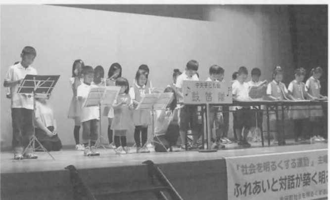
▶中央鼓笛隊の演奏