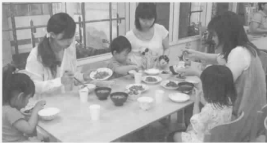
▲前回の親子キッチン ~すまあとごはん~ いっしょに食べるとおいしいね!