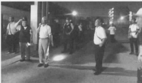
各種団体・町・警察などで、夜間パトロールに取り組んでいます。

蛇口をひねればいつでも出る水。ふだん当り前に使う水も貴重な資源です。特に、夏は温水などで、水が不足する時期です。大切に有効に使いましょう。