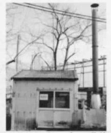
クリーンセンター内の動物炉