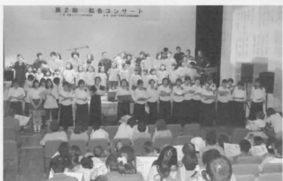
第2期 虹色コンサート

①電話等での受付は行っておりません。役場4階産業振興課までお越しください。 ②抽選は1世帯につき1名。