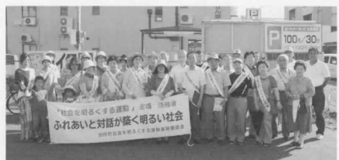
▲強調月間行事の街頭啓発 (7/11・ライフ忠岡店前)

受付期間 9/2～10 (土・日は除く) 申し込み・問い合わせ先 岸城夜間中学校 岸和田市野田町2丁目19の19 072・438・6553 殿馬場夜間中学校 堺市堺区櫛屋町東3丁目2の2 072・221・0755