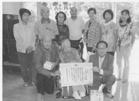
100歳 内閣総理大臣表彰