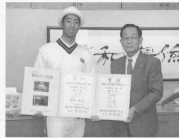
▲日本学生選手権でも個人で第3位