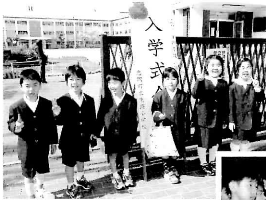
▲これからみんないっしょだね (忠岡小学校)