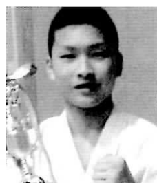
(極真会館関西総本部 岸和田支部所属)