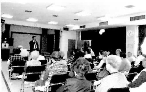
▶高齢者交通安全教室 (4/19)

子どもと高齢者の交通事故防止 今年度の交通安全運動は、4/5の交通安全推進協議会総会をスタートに、駅前での啓発・めいわく駐車追放キャンペーンなど、さまざまな取り組みが行われました。