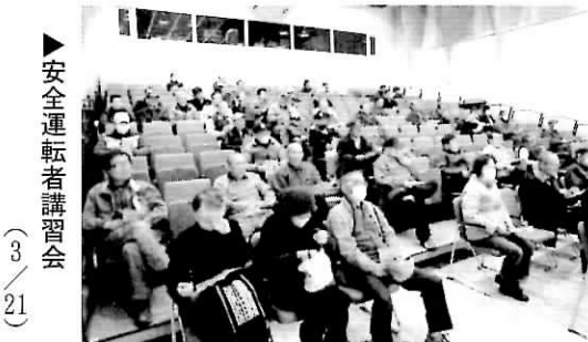
▶安全運転者講習会 (3/21)