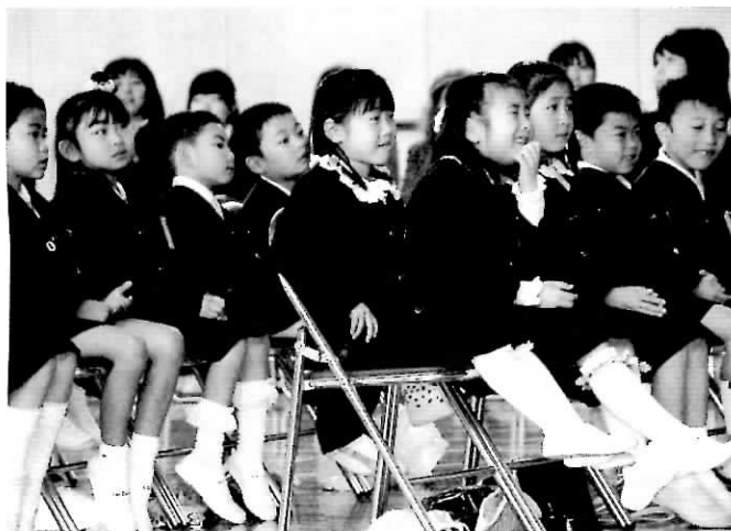
▲やっとな緊張がとけてみんな笑顔に… (忠岡小学校)