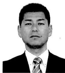
(忠岡中学校 / 子ども支援コーディネーター)