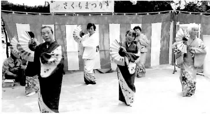
春を彩るステージで華やかに発表【4/10】

桜の下で 春を楽しみました 子ども達の熱演に 観客の皆さんも大声援を披露! ▶忠岡保育所の5歳児さんも歌を披露!