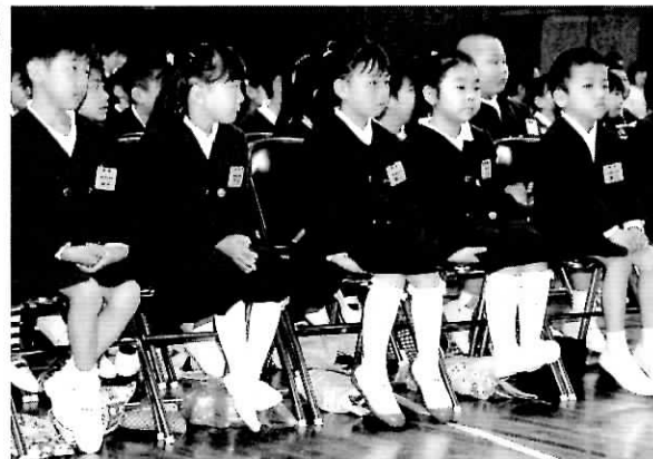
ちょっぴり緊張しました▶ (東忠岡小学校)