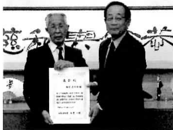
福祉行政に顕著な功績 (志岡南2丁目)