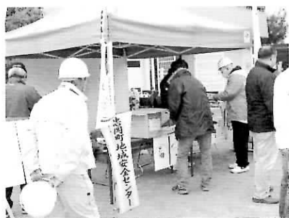
12/11 防災訓練特設会場で実施