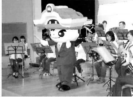
▶ただお課長も指揮で参加