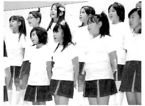
▶こどもたちの合唱 (パンピーナ)