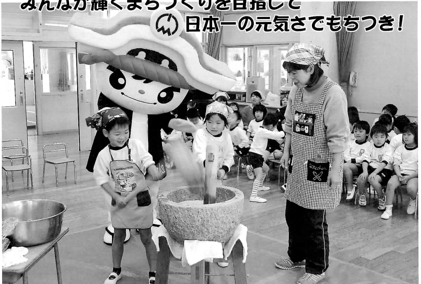
▶ただお課長も参加(東忠岡保育所)