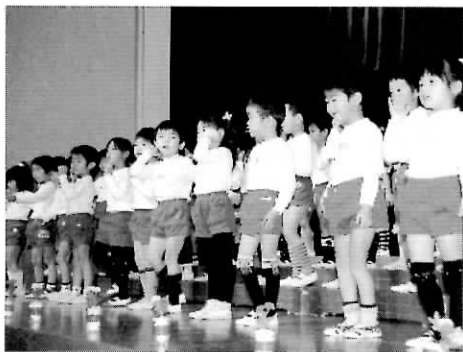
▲東志岡幼稚園 (12/8ふれあいホール) ▲志岡幼稚園(12/7同園)

1月16日(月)～2月29日(水)にねずみ駆除薬剤と粘着シートをセットにして(お一人様1セット・先着60名)無料配布します。ご希望される方(各家庭、事業所等)は生活環境課窓口までお越しください。 ▼清掃ボランティアの募集について 道路や公園などの公共用地を、善意で掃除していただける意欲のある方に、ボランティア用ごみ袋を配布しています。ご希望される方は、ボランティア登録をしていただきますので、印鑑を持って生活環境課までお越しください。