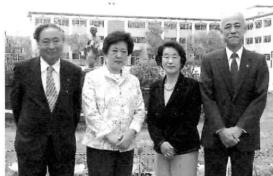
忠岡町人権擁護委員