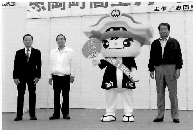
▲ハッピー姿で登場！（左から和田町長、萬野商工会会長、高見自治会連合会会長）