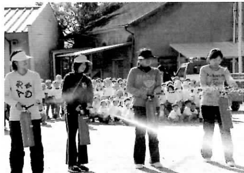
◀消火器訓練 先生が訓練に挑戦 (東忠岡幼稚園)