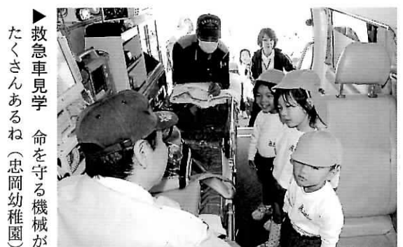
▶救急車見学 命を守る機械がたくさんあるね (忠岡幼稚園)