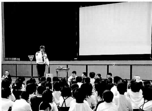
◀ビデオで勉強したよ！ (東忠岡小学校)

受付時間 教育総務課（土日を除く9:00～17:30） 児童館（土日の10:00～17:00）