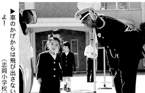
▶車のかけからは飛び出さないよ！ (忠岡小学校)