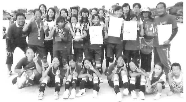
写真上 ソフト優勝の馬瀬こども会 写真左 キック優勝の青空こども会