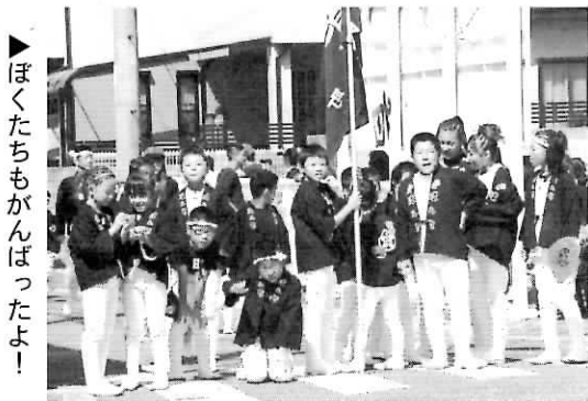
▲ぼくたちもがんばったよ!