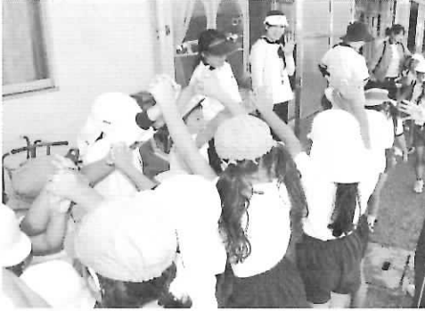
▶ミニ運動会のあと