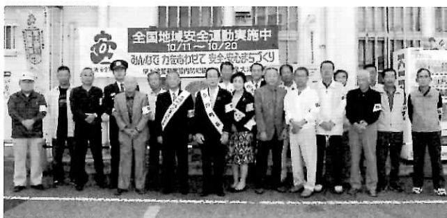
▲地域安全運動街頭啓発 【駅前 10/12】

第2部アトラクションでは、府警本部音楽隊による演奏やカラーガード隊のフラッグパフォーマンスが行われ、大会に華をそえていました。