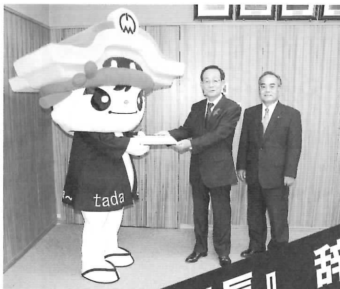
◀日本一元気課課長の辞令をうける『ただお課長』

H P http://www.town.tadaoka.osaka.jp/ Eメール koho@town.tadaoka.osaka.jp