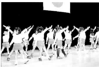
▲東忠岡幼稚園児の演技

第2部では、東忠岡幼稚園児の演技、府警本部生活指導班の防犯劇、忠岡S A Fによる寸劇と勇壮な太鼓