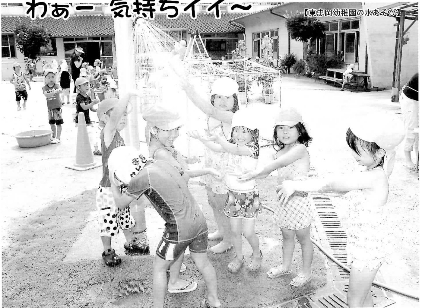
【東忠岡幼稚園の水あそび】