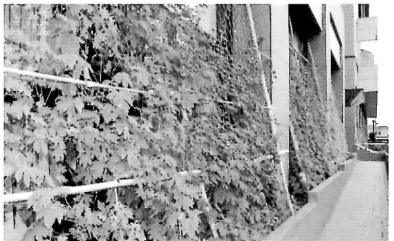
▲すっかり緑のカーテンにおおわれた役場南面

これは、キッズクラブが毎年行っている行事で、29日には町長や社会福祉協議会の高齢者も参加し、みんなで収穫をお祝いしました。