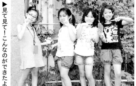
▶見て見て!こんなのができたよ