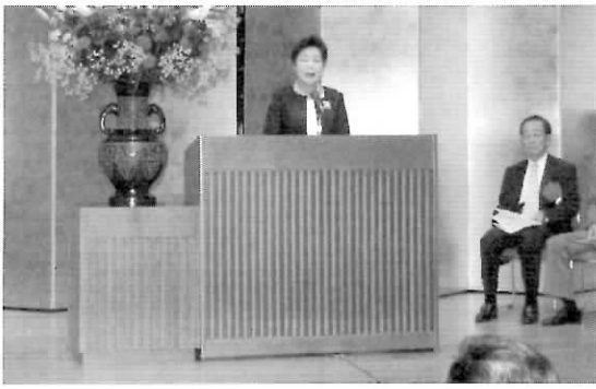
▲あいさつする上ノ山会長

また、当日は同協議会の設立や運営に多大な貢献をされてきた方々に対して、表彰状ならびに感謝状の贈呈が行われました。