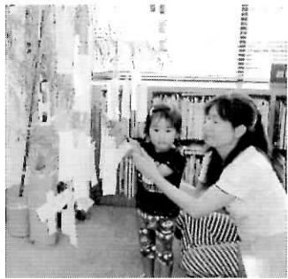
▲七夕かざりのようす

お知らせ..... 非核・平和図書コーナー 8月3日(水)〜20日(土) 非核平和をテーマにした本 を特集しています。 「課題図書」 揃えています！ 貸出は1週間。その他、夏 休みの宿題に役立つ工作や自 由研究の本なども特集。