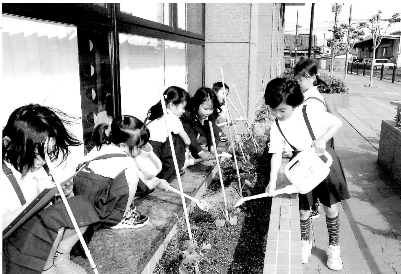
シビックセンターでの、忠岡町放課後子ども教室（キッズクラブ）の子どもたちによる緑化活動（ゴーヤ植え）

町内では、6月の環境月間とあわせて、庁舎、水源地、文化会館など各所でゴーヤなどによる緑化運動が行われました。7月には大きく育ち、美観とあわせて空調などのエネルギー消費の軽減にも一役買いそうです。