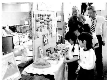
▲「すごーい」と子どもたちもビックリ!(役場エントランス)