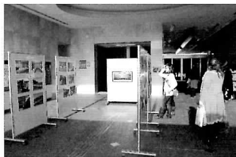
南館エントランス (11/13~18)

第1巻 人権のまちづくり 第2巻 宅地建物取引におけ る土地差別 ☆ご希望の方は、役場5階人権 平和室までご連絡ください。 ☎ 22-1122