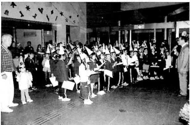
▲あざやかに 点灯しました