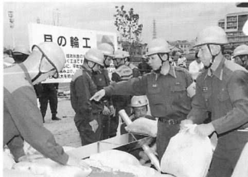
▶月ノ輪工法に挑戦する 本町署員