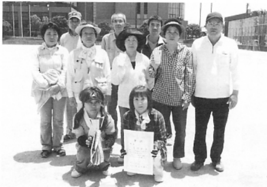
よろこびの若竹Bチーム