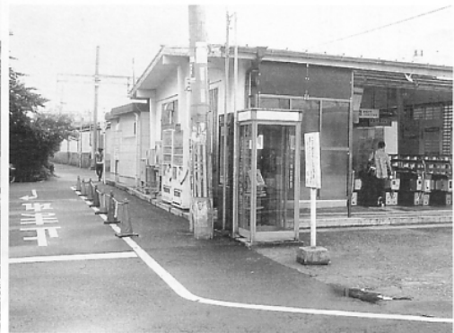
▼快適な駅周辺の様子