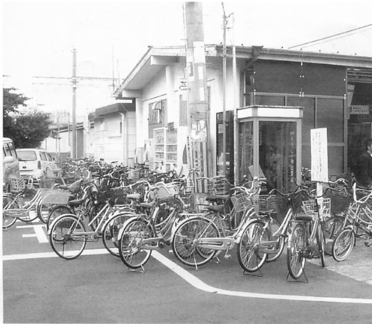
◀不法駐輪が多い様子

HP http://www.town.tadaoka.osaka.jp/ Eメール koho@town.tadaoka.osaka.jp