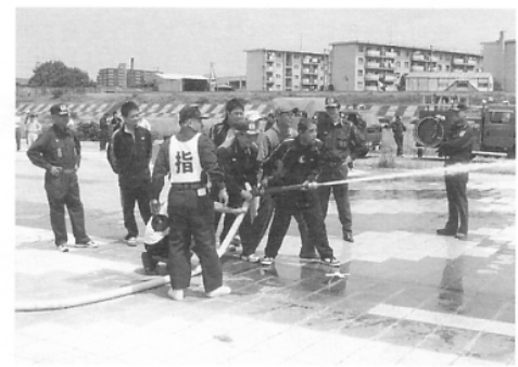
写真は、消防団員の指導による天ぶら油火災消火訓練、模擬消火栓訓練等。