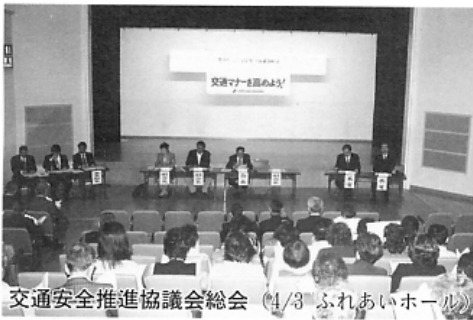
交通安全推進協議会総会 (4/3 ふれあいホール)