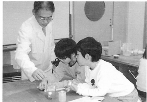
▶化学実験に挑戦【児童館】