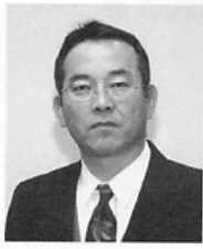
(忠岡中学校) 生徒指導主事