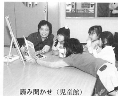
読み聞かせ(児童館)

ボランティア募集 ・学校支援 ・放課後子ども教室 ・障害者(児)付き添いサー ビス など 【社会教育課・児童館】