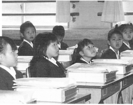
▲ちよっぴり緊張しちゃうね 忠岡小学校【4/7】 ◀元氣にお返事できたかな？ 東忠岡小学校【4/7】