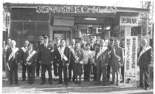
駅前での街頭啓発 (4/6)

こども会 春の球技大会 各地区よりキック、ソフト ボールチームが多数参加 ▼とき 5月10日(日) 《開会式》午前8時30分 《試合開始》午前9時 (雨天の時は5月17日に 延期) ▼ところ 新浜緑地