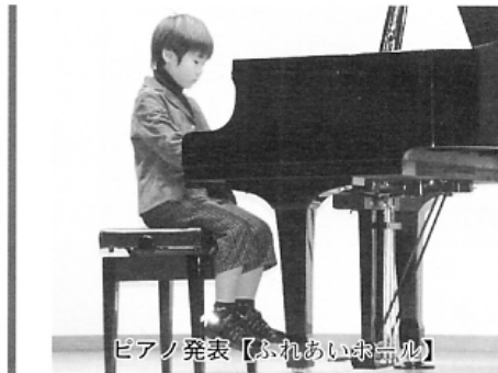
ピアノ発表【ふれあい音楽会】