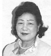
馬瀬 1-7-15 ☎21-4770