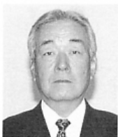
馬瀬 1-14-18 ☎33-6616

春の行政相談 強調月間 国政に関する相談、年金問題、警察やJR、また身近な行政の問題で「困っている」「わからない」「改善してほしい」ことはありませんか？お気軽にご相談ください。 特設行政相談所を開設 日時 5月20日(水) 10時～16時 会場 高島屋堺店8階特設 会場(南海高野線東駅) 【問】総務省 近畿管区行政評価局 ☎06・6941・3431