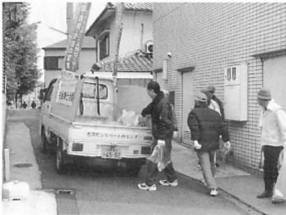
◀シルバー人材センター有志による町内清掃。トラックいっぱいのごみを回収【4/28】