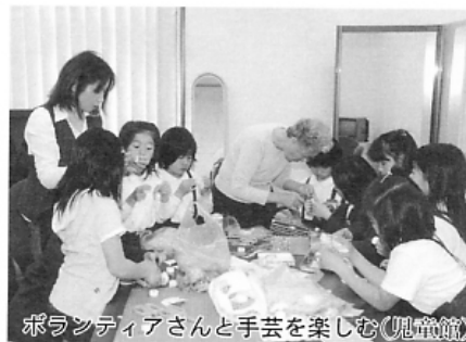
ボランティアさんと手芸を楽しむ(児童館)

こども会 春の球技大会 各地区よりキック、ソフト ボールチームが多数参加 ▼とき 5月10日(日) 《開会式》午前8時30分 《試合開始》午前9時 (雨天の時は5月17日に 延期) ▼ところ 新浜緑地