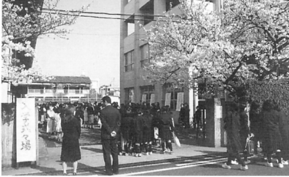
▲満開のさくらに祝福されて忠岡中学校【4/6】