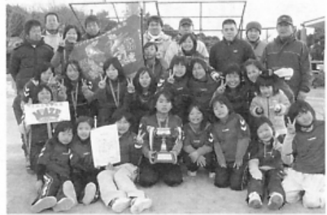
2008年度ファイナルカップ球技大会 キックベースボール優勝 馬瀬 ソフトボール優勝 北区 【新浜緑地公園 1/13】