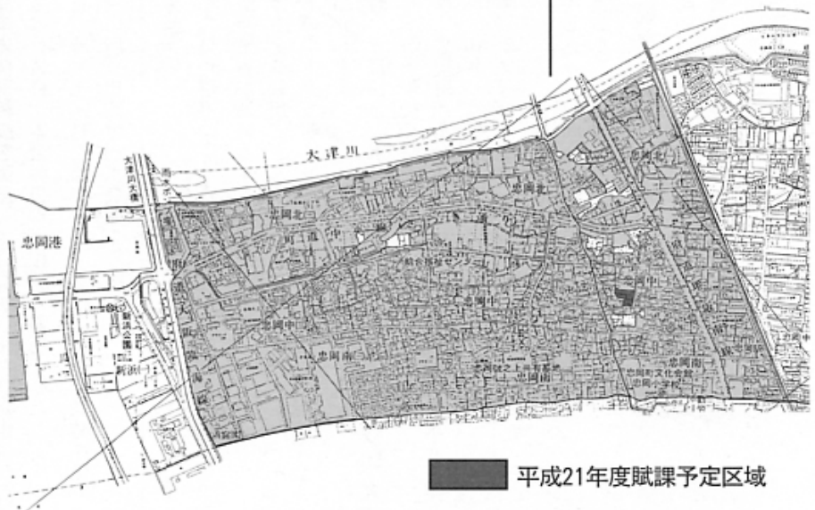
平成21年度賦課予定区域

受益者負担金お支払いのお願い 本町では、これまで多額の費用を投資し、下水道整備を鋭意すすめてきました。この整備の一部については、地域のみなさまに受益者負担金というかたちでお願いしております。既に下水道管を敷設している地域も含めて、今後、受益者負担金をより積極的に徴収してまいりますので、住民みなさまのご理解とご協力のほど、よろしくお願いいたします。