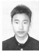
忠岡中学校 [忠岡南1丁目]