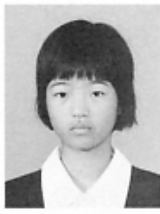
和歌山 信愛中学校 [北出 2丁目]

第20回都道府県対抗 全日本中学生 ソフトテニス大会 本町から 2選手が出場決定