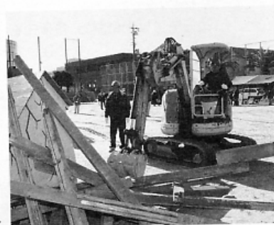
障害物撤去 (建設業協会) ▶