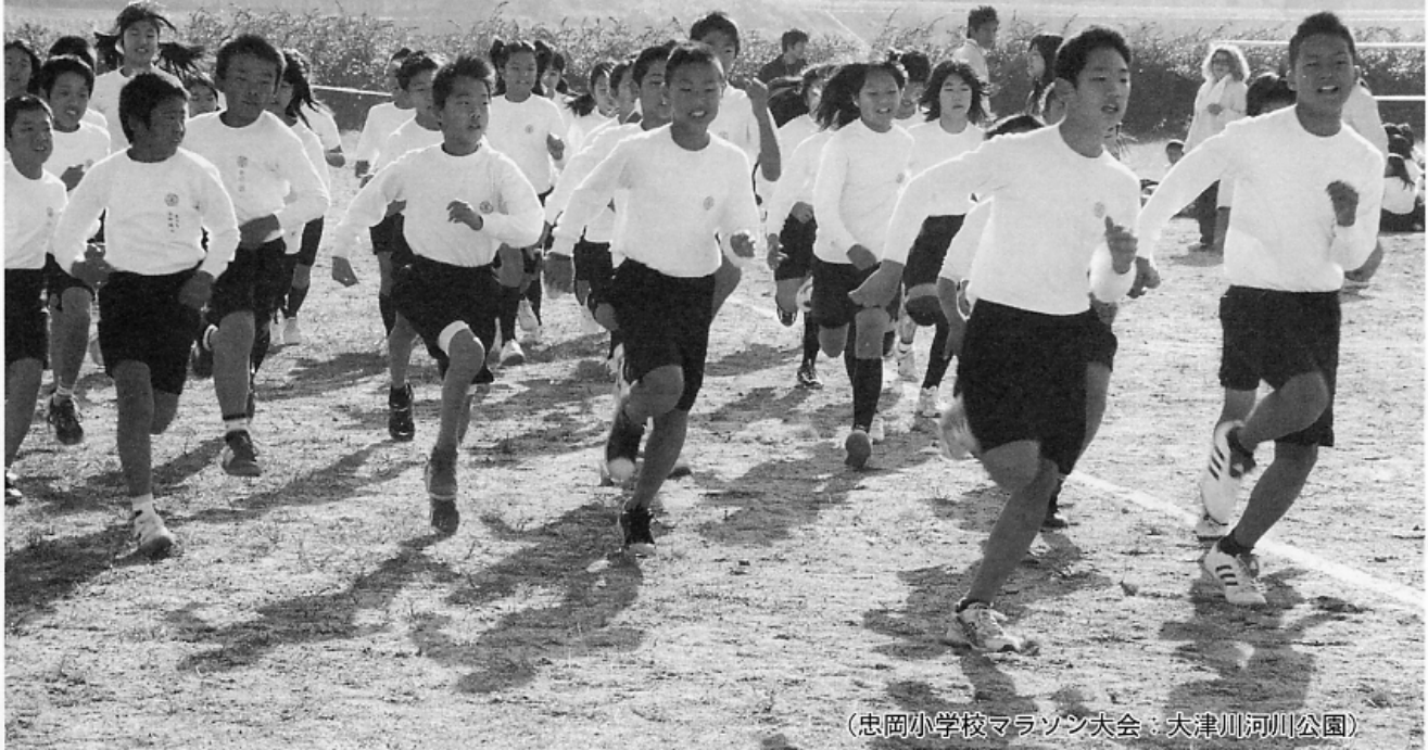
（忠岡小学校マラソン大会：大津川河川公園）