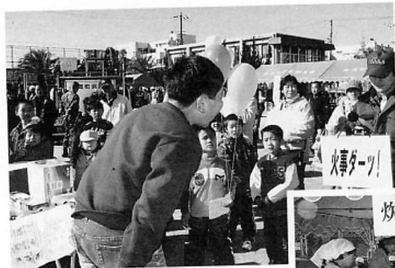
▲大声出しコンテスト… 『火事だーっ』 北出婦人会の炊き出し▶