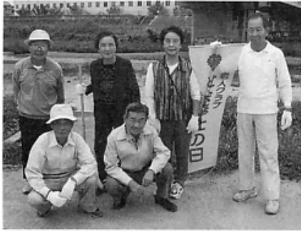
▲大津川河川公園（西側）