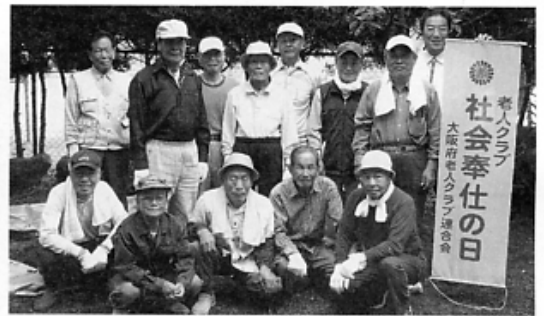
▶総合福祉センター

木 き になる夢銀行 ゆめぎんこう どんぐりを集めて 苗木 なえ をもらおう! ドングリ50個以上を預けると通帳が発行されます。 預けたドングリ100個ごとに、翌年の春に苗木1本を払い戻します。 ■預入締切 平成20年11月30日まで ■預入窓口 役場生活環境課