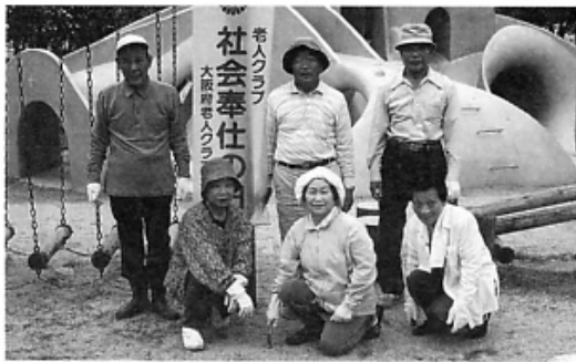
▶町民グラウンド ◀北出タコ公園