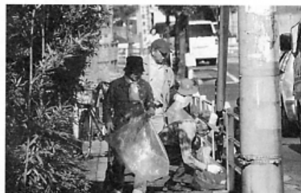
▲100名の方々が参加されました

木 き になる夢銀行 ゆめぎんこう どんぐりを集めて 苗木 なえ をもらおう! ドングリ50個以上を預けると通帳が発行されます。 預けたドングリ100個ごとに、翌年の春に苗木1本を払い戻します。 ■預入締切 平成20年11月30日まで ■預入窓口 役場生活環境課