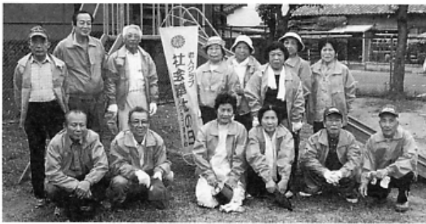
▶大津川河川公園（東側） ◀馬瀬児童遊園