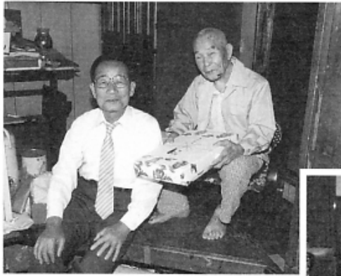
▲お祝いにかけてつけた町長と