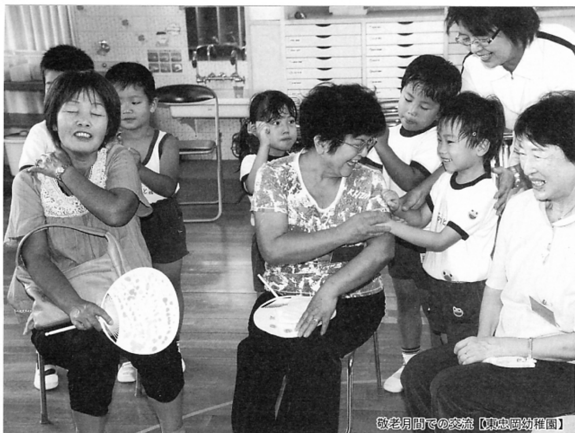
敬老月間での交流【東忠岡幼稚園】

H P http://www.town.tadaoka.osaka.jp/ Eメール koho@town.tadaoka.osaka.jp