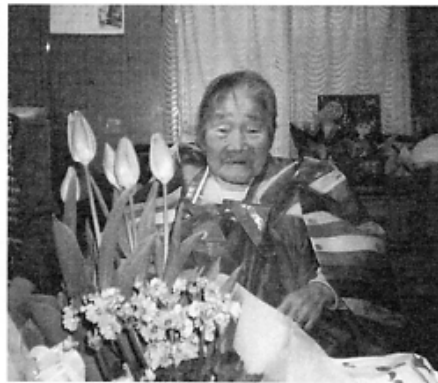
▲長寿を祝福する花に囲まれて