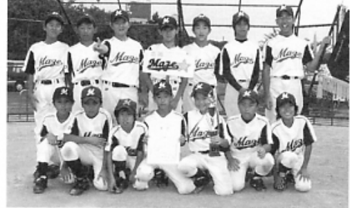
ソフトボール優勝の馬瀬こども会