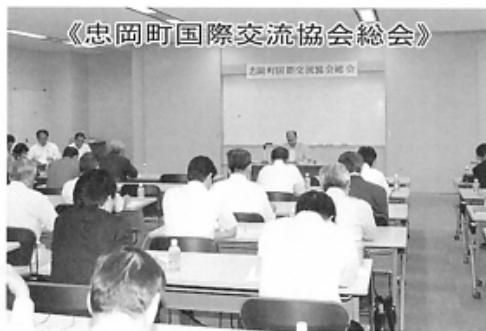
《忠岡町国際交流協会総会》