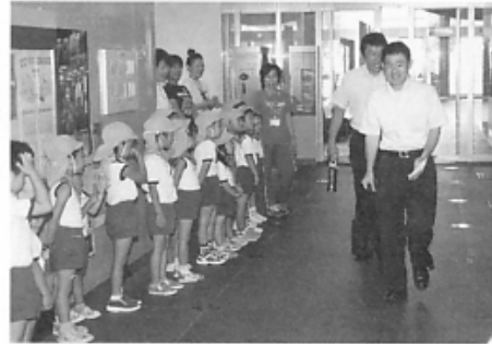
《7/5 シビックセンター》