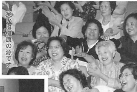
笑いは健康の源です