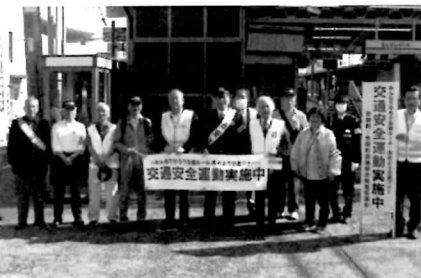
▲地域・警察・行政が一体となって交通安全を訴えました