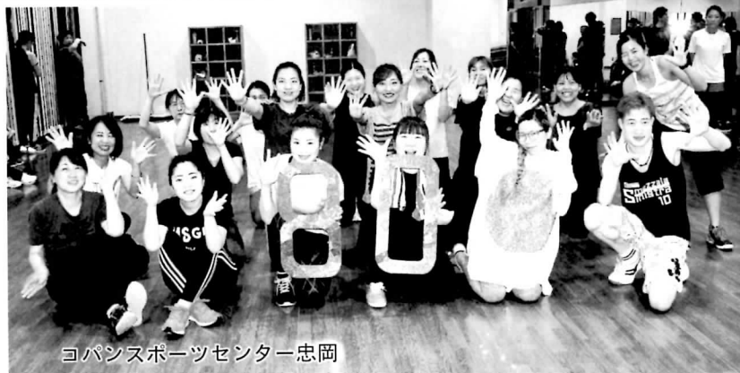
ヨパンスポーツセンター忠岡