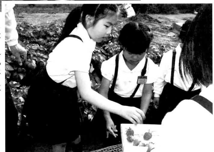
▶大きく育ったイチゴ （馬瀬3丁目キッズ農園）

イチゴは、子どもたちが昨年末に植えたもので、ゴーヤは、7月の収穫を目指して大切に育てられます。