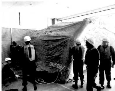
▲自分の町は私たちが守る！

忠岡町消防団では、団員を募集しています。町を守るため、あなたの『力』を！！ 【問】消防本部 ☎31・0119