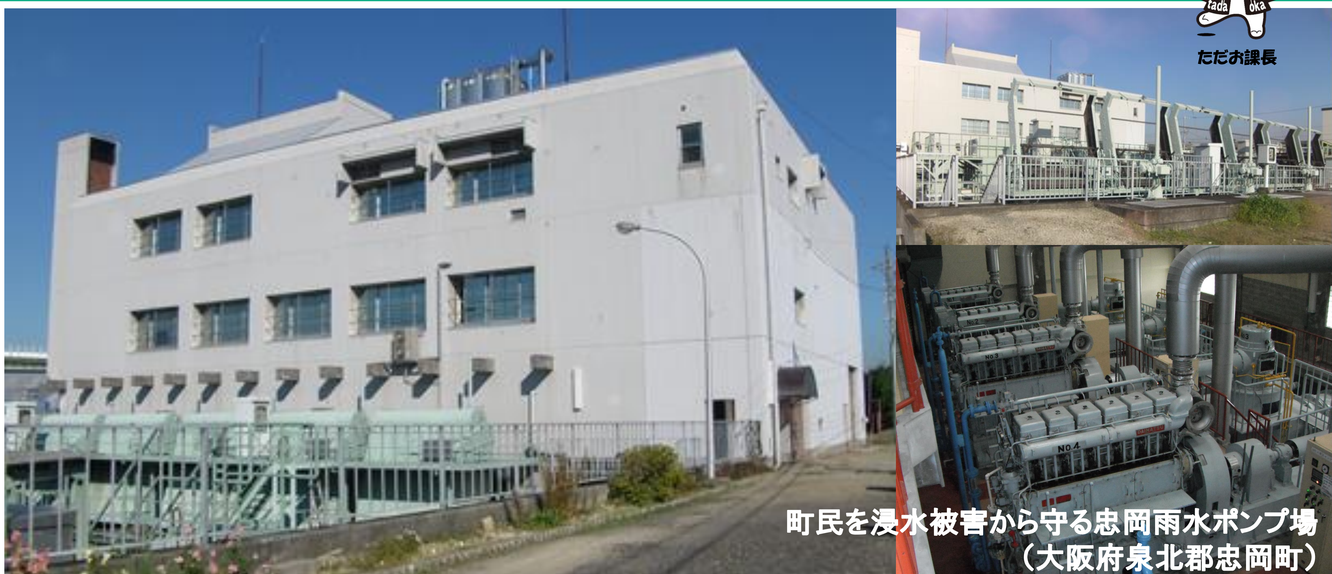
町民を浸水被害から守る忠岡雨水ポンプ場 (大阪府泉北郡忠岡町)